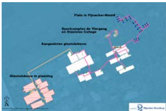
Schema warmtenet Pijnacker.

Sinds 2016 zijn 470 flatwoningen in Pijnacker aangesloten op de geothermiebron van potplantenkwekerij Van Ammerlaan The Green Innovator. VB Projects legde de leidingen naar de zestien bestaande flatgebouwen van Rondon Wonen. Ammerlaan heeft hiermee een primeur: de eerste warmtelevering vanuit een geothermiebron aan woningen in Nederland. Al eerder was de warmtelevering uitgebreid naar kassen van bedrijven in de omgeving, een zwembad en een school.