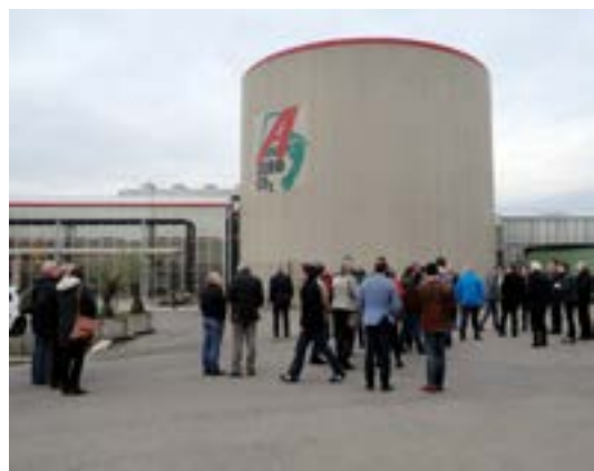
Geïnteresseerden op bezoek bij het geothermische project Ammerlaan in Pijnacker.