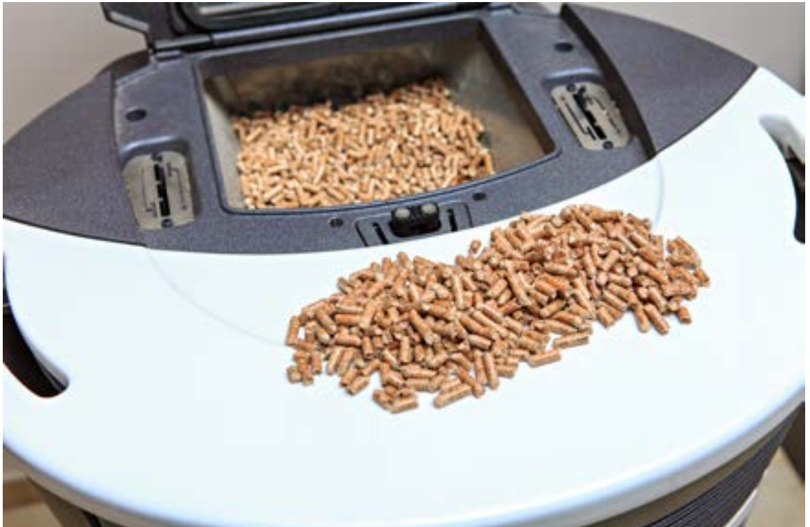
Biomassa in de vorm van houtpellets.

Afhankelijk van lokale omstandigheden zijn alternatieve brandstoffen mogelijk zoals groen gas en biomassa. De beschikbaarheid is echter beperkt en de duurzaamheid van deze brandstoffen hangt af van de wijze waarop ze worden geproduceerd en het rendement van de omzetting.