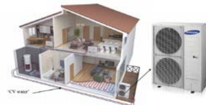
Woning met luchtwaterpomp. De grootte van de buitenunit is afhankelijk van het benodigde vermogen.