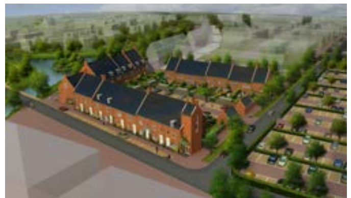
Nul-op-de-meter woningen ontworpen in Delftse School stijl. Met bodemwarmtepompen en PV, opgeleverd 2017. Ontwikkelaar AM, uitgevoerd door BAM Woningbouw.

Bij levering van warm tapwater is een temperatuur nodig waarbij legionellabesmetting wordt voorkomen. De regel die daarvoor in Nederland wordt gevolgd, is een temperatuur op de tappunten van minimaal 55 °C. Een warmwaterboiler moet regelmatig, bijvoorbeeld eens per week, kort op 60 °C worden gebracht om te desinfecteren. De nieuwste warmtepompen kunnen deze temperaturen leveren. Bij een collectief warmtenet (laag en midden temperatuur) kan hiervoor een individuele boosterwarmtepomp worden gebruikt.