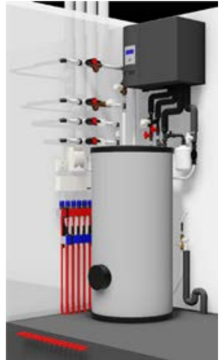
De boosterwarmtepomp is een nieuwe techniek en wordt nu in de eerste projecten toegepast.