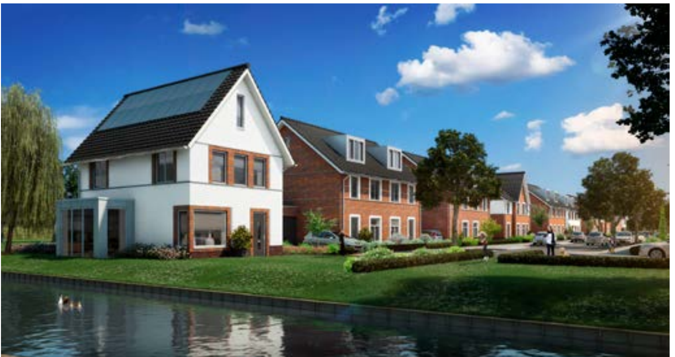
Energie neutrale woningen Park Harga, Schiedam. Oplevering 2018. VolkerWessels Vastgoed.

Centraal opgewekte elektriciteit is nu nog voor het leeuwendeel afkomstig uit fossiele brandstoffen. In 2017 was het aandeel hernieuwbaar 13,8 procent van het totaal. Dit aandeel groeit de laatste jaren sterk, vooral dankzij de winning van windenergie op zee.