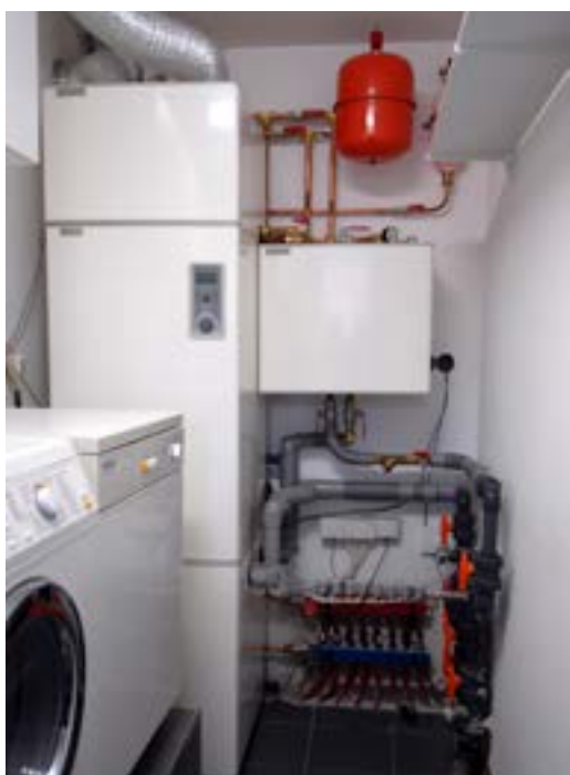
Links de bodemwarmtepomp en rechts een koelmodule om de woning passief te koelen. Er zijn ook modellen waar de koelmodule in de unit voor de warmtepomp is opgenomen.