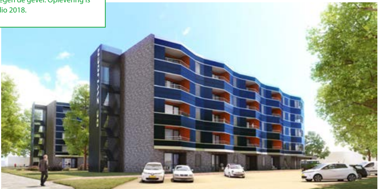
48 NOM-appartementen in Best met bodemwarmtepomp en PV-panelen op het dak en tegen de gevel. Ontwerp: NBArchitecten

In opdracht van Woningcorporatie 'Thuis' bouwt BAM Wonen in Best twee NOM-appartementengebouwen met 48 NOM-eenheden verdeeld over vijf verdiepingen. De woningen worden zeer goed geïsoleerd en voorzien van een bodemwarmtepomp en ventilatie met warmteterugwinning. De benodigde elektriciteit wordt opgewekt met PV-panelen op dak en tegen de gevel. Oplevering is medio 2018.