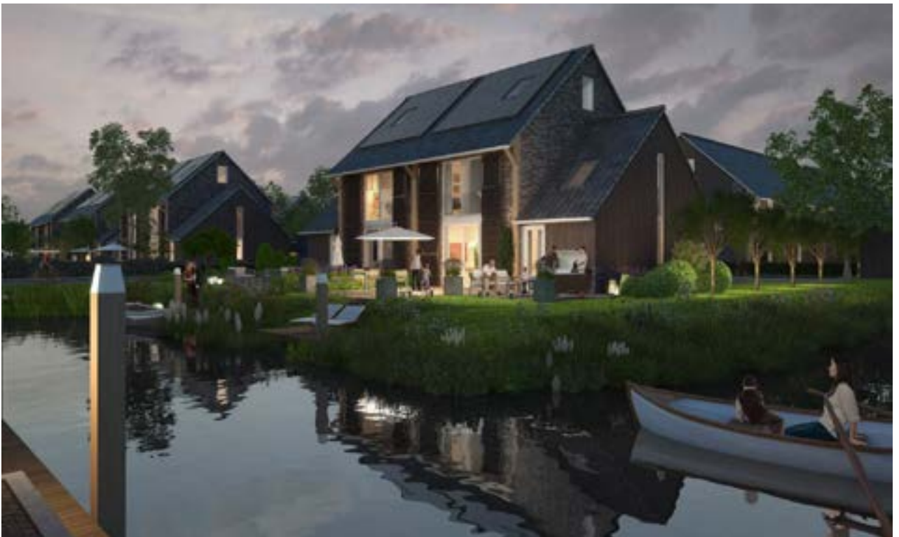
EPC-nulwoningen Eilanden van Sion, Rijswijk Buiten. Ontwikkelaar AM.

Zonne-energie die een woning (op dak en gevel) ontvangt, kan actief worden benut met zonnecollectoren en PV-panelen 1 .