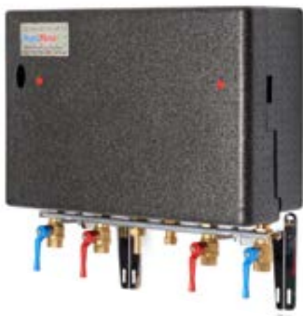
Afleverzet voor externe warmtelevering