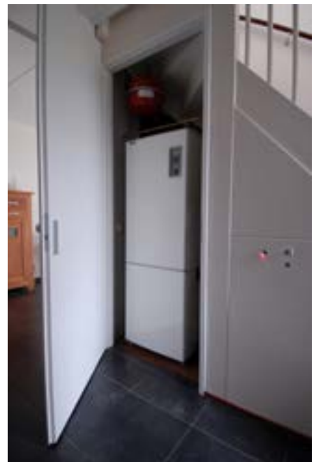
All electric oplossing met bodemwarmtepomp in de trapkast. Deze combiwarmtepomp zorgt voor verwarming en warm tapwater.

IR-verwarming is relatief goedkoop in aanschaf, zeker vergeleken met een warmtepomp. Het energiegebruik is echter hoog. In een goed geïsoleerde nieuwbouw-tussenvoning is een vermogen van 30 Watt per vierkante meter vloeroppervlakte nodig. IR-verwarming is hierdoor vooral geschikt als bijverwarming in situaties met een plaatselijke en/of tijdelijke warmtevraag. Als (enige) hoofdverwarming is het energetisch en financieel onvoordelig. Bedenk daarbij dat een kamer die nu