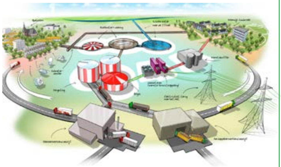
Schema Energiefabriek Apeldoorn

De rioolwaterzuivering van Apeldoorn is de eerste zogenaamde energiefabriek van de waterschappen. In de nieuwe wijk Zuidbroek krijgen 1500 woningen hiervan energie. Door de RWZI wordt rioolslib vergist en in biogasmotoren omgezet. In 2015 was dit goed voor 48% van de benodigde warmte in Zuidbroek. De rest werd geleverd door biomassaketels van Ennatuurlijk (38%) en aardgas (11%).