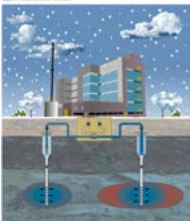
Open recirculatie winter